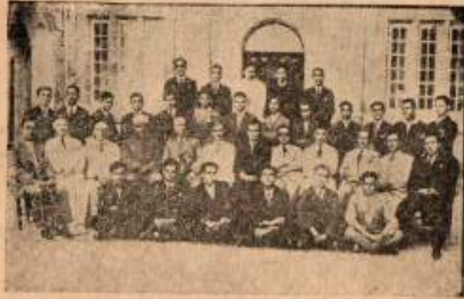
1930-31 Lise mezunları ve heyeti talimiyesi.

vekâleten idare edildi ve müdürlüğe İngiltereden Mr. Grand ce' b lli.