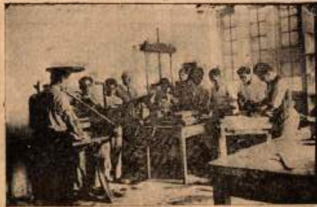
Mücellithane kısmında bir çalışma anı.

Mektebin bu sene başlayan bir de mücellithanesi vardır. Burada mütehassıs ve sanatkâr bir muallimin nezaret ve yardımı ile çocuklar kitap ciltlemeği mütenevvi defterler yapmağı, harita ve sair bezlemeği, süngar kâğıdı koymak için altırk, albüm bezden, muşamba veya deriden cep cüzdanları,