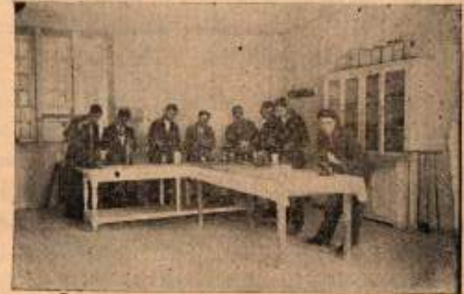
Fizik laboratuvarında bir çalıřma tarzı.

Şuraya kadar âlemi maddiyatı ve kendisini teşkil eden cüzülterin hareketından tevellüt eden hadisatı tetkik ettik. Birazla cüzüldin bünyesini tetkik edelim.