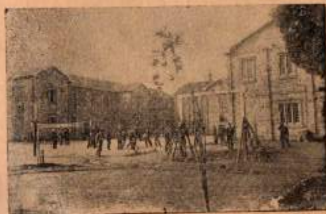
Lisenin soldan görüldüğü

Türk Erkek Lisesi Kıbrısın merkezi olan Lefkoşada, leylî ve nihari, tam devreli bir lisedir.