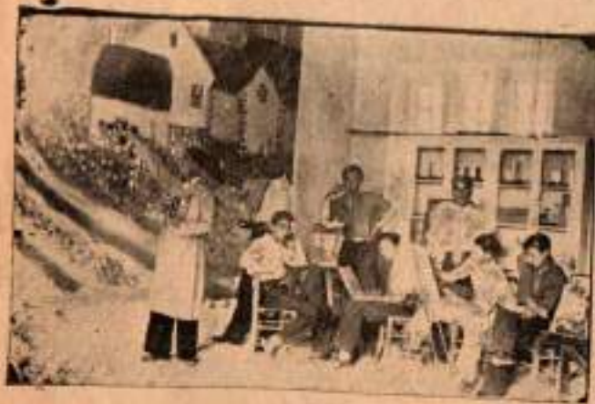
Resim odasında çalışanlar