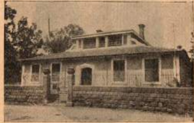
Eski Ruştiye binasının bulunduğu yere yeniden yapılan eski İdadi, Sultani ve eski Lise binası.