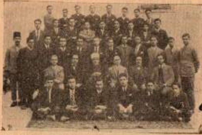
1927-28 senesi Lise mezunları heyeti talimiyesi.