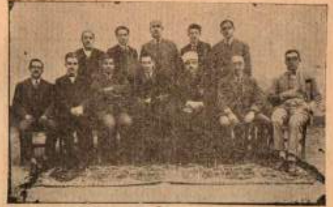
1928-29 ve 30 heyeti talimiyesi

Lisede yeni teşkilât yapılarak Lise sınıfları ve Lise programı eskisi gibi ipka ve muhafaza edilmek şartıyla ilâveten bir de Kollej şubesi tesis olundu, ve Kollej muallimliğine İngiltereden Mr. Alford getirildi.