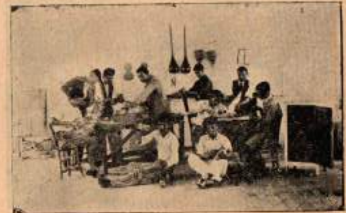
Marağoz şubesinde ince işler kısmı.

Talebe amelî ve tatbiki işlerin bir kısmını da atelielerde görür. Hendese ameliyat ve tatbikatının resmi hattı tatbiklerinin hususî bir kısmını pek yeni, pek küçük fakat oldukça faydalı olan marağozhanede görür. Kırlan sıra,