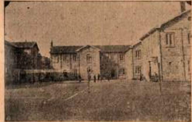
Lisenin sağdan görünüşü

Türkçeden gayri İngilizce ve Rumca da okunur.