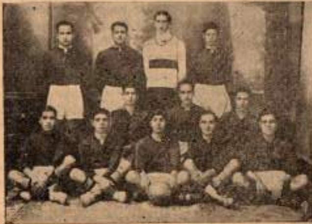
1932-33 senesinin 11 leri,

Geçen sene futbol sahasında mektebia dört ve bu sene