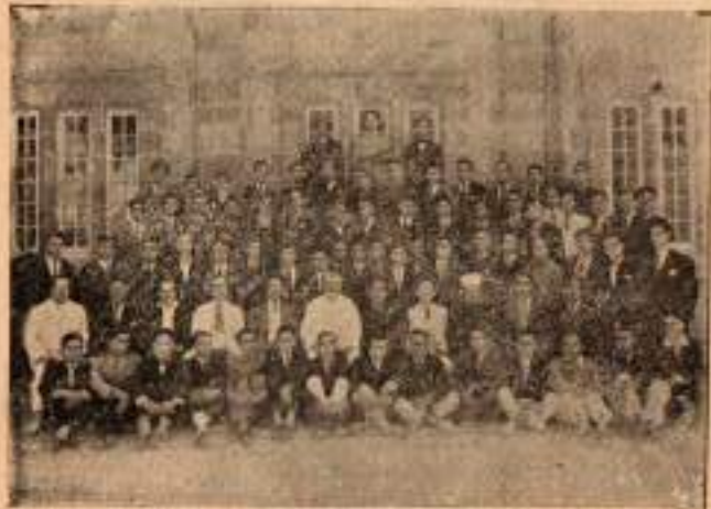
1931-32 Lise mezunları ve heyeti talimiyesi