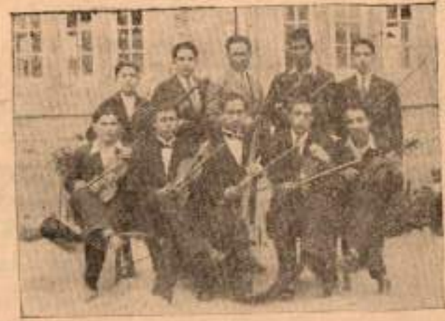
Orkestradan bir grup

Buraya kadar pek güzel, lâkin bandomuz lazla terakki edebilir, eğer her talebe her gün kendi aleti üzerinde akıllı yarım saat kadar meşk ederse, böylece dudaklar daha ziyade neşünema bulur ve çalan fertlerin daha ziyade iyi çalmasına ve dinleyenlerinde daha ziyade dinlemesine yardım eder. Hattada iki defa bando dersi vardır, eğer talebe dersini öğrenmiş olarak gelirse terakki dört kat lazla olur.