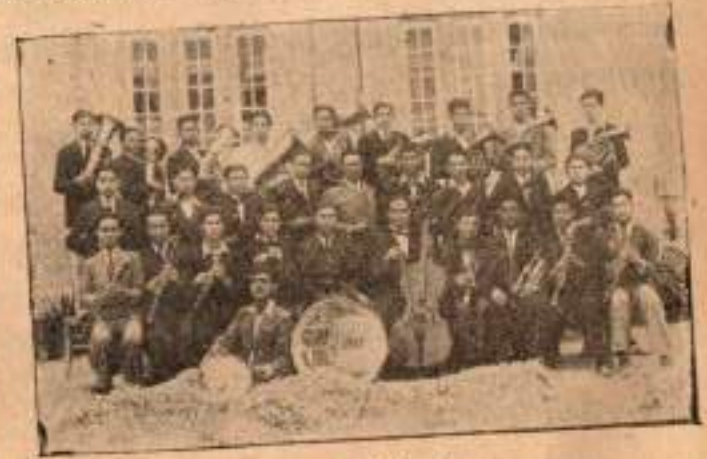
Bando ve Orkestra

1932—33 Müdür İ. Hikmet Bey geldiğinde bandomuzu teşkil eden elendilerin hemen bütününde müptedi idi, ve bir sene zarfında büyük bir terakki gösterdiler.