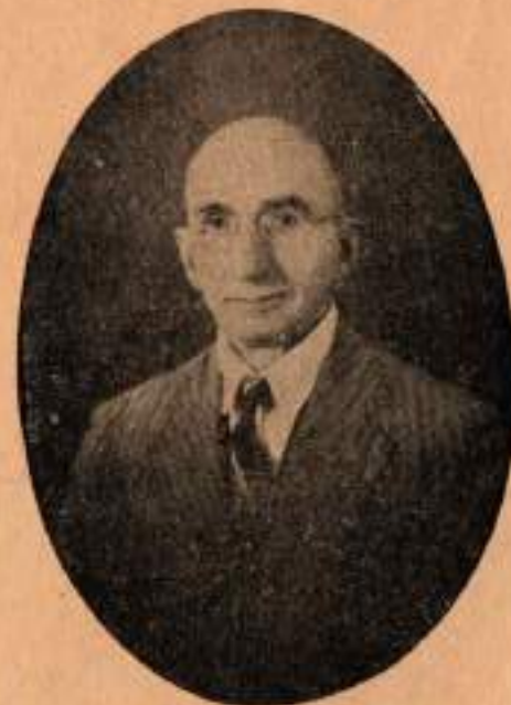
DOKTOR NURİ BEY