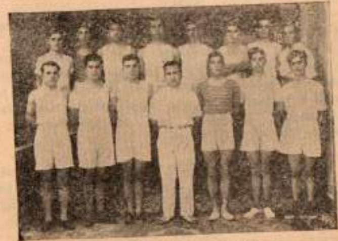
1933 senesi Atletizimde Kazananlar.

Lisede Atletizime 1923 te başlanmıştır. Şöyle böyle 11 senelik hayatı olan bu pek zevkli spor oyunları her sene ilk bahar mevsiminde oynanmaktadır. Kimin zamanında ve kimin tarafından başlatıldığı kat'i suretle tespit edilmeyen bu oyunlara her sene futbol mevsimini müleakip bir buçuk iki ay kadar bir müddet ayrılarak çalışılıyor ve ekseriyetle Nisan ayında muayyen bir gün ayrılarak Hükûmetin oyun sahasında, unumun muvaceh - sinde, müsabaka mahiyetinde, yine mektebin kondi tatebesi bir arasında oynanıyor. Bugün talebenin en zevkli ve unutulmaz günüdür. 1928 senesine kadar alınan neticeler tespit edilememiş ise de çok iyi koşucular, atlayıcılar ve atıcılar yetişmiştir. Ve elyevm yetişmektedir. 1928 de Mr. Henri'nin gayretile bütün spor netayici tespit edilmiş ve o senenin mecmûc.ında gösterilmiştir. Ondan sonra 1933 senesine kadar bu cihet yine ihmal edilmiş ve nihayet 1933 de tekrar tespit edilmiş, zirde gösterilmektedir: