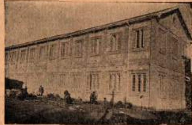
Dershanelerin haricden görünüşü

edebiyatını alır. Aralarında bölüşerek her biri bir bakımdan o edebiyatı sınıf haricinde, kütüphanede mevcut kitaplardan faydalanarak birer konferans halinde hazırlar. Meslekler, felsefi kanaatler noktalarından araştırmalar yapar. Şairlerin hayatı, tanzir ve ya taklit ettikleri büyük ve şöhretli şahsiyetler, onların asırları, hayatları ve eserleri hakkında malûmat ve vesika toplar. Mukayeseli, tenkitli