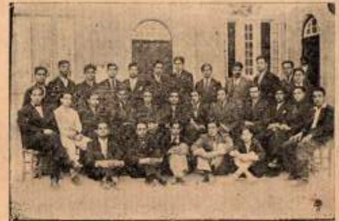
K. T. L. Talebe Birliği.

Leyli talebe münferiden yemek yapar ve münferiden yerd. Her fert kendi hesabına çalışırdı. Birlik vücuda gelince talbe kendi arasında bir teşkilât yapıp nöbetle yemek pişirmek, nöbetle bulaşık ve çamaşır yıkamak nöbetle çarşıdan malzeme ve erzak almak, nöbetle yemekler taşıdıp sofralara hazırlamak ve toplamak esaslarını kabul etti