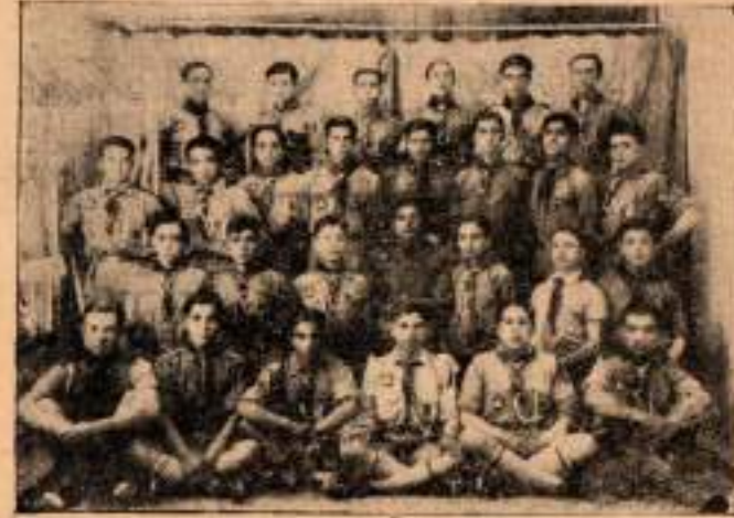
Lise İzci Grubu

Mektebimizin izci levazimatı hemen yok gibidir. Bir çok şeye ihtiyaçları olduğu gibi bir de toplantı odasına lüzum vardır.